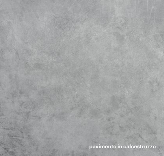
pavimento in calcestruzzo