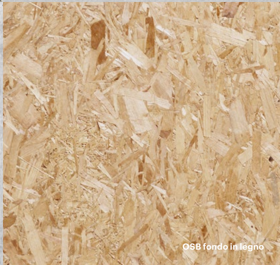
OSB fondo in legno