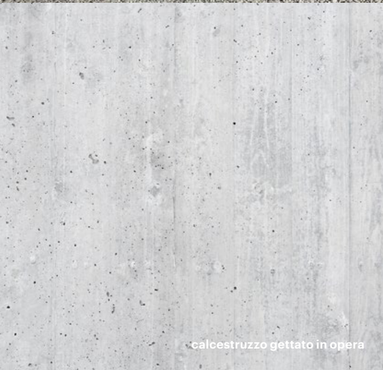
calcestruzzo gettato in opera